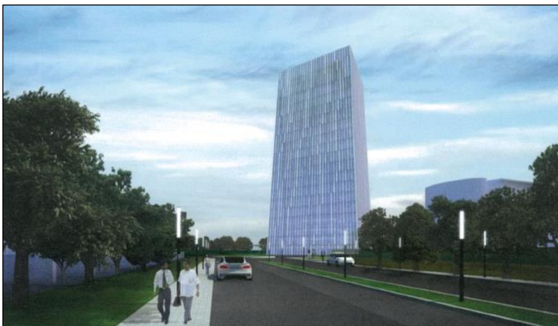
ที่มา : รายงานการประเมินผลกระทบสิ่งแวดล้อม โครงการอาคารสำนักงานและการศึกษา, 2561

อาคารสำนักงานและการศึกษาของโครงการ มีรูปแบบทางสถาปัตยกรรมเป็นอาคารแนวสมัยใหม่ (Modern) มีแนวความคิดการออกแบบให้สอดคล้องกับสภาพพื้นที่ เน้นการประหยัดพลังงาน และเกิดความสะอาดสบายในการทำงาน รูปทรงของอาคารเป็นรูปสี่เหลี่ยม พร้อมทั้งเลือกใช้แสงสว่างแบบธรรมชาติ เน้นความสวยงามของอาคาร โดยมีการเลือกใช้กระจกที่มีประสิทธิภาพสูงในการป้องกันความร้อน เพื่อช่วยในการลดความร้อนเข้าสู่ตัวอาคาร และเนื่องจากอาคารเป็นด้านเท่า ส่วน Core และ Service อยู่กลาง พื้นที่ทำงานอยู่รอบ ทิศทางในการวางแนวอาคารจึงไม่มีผลในการจัดวางแนวอาคาร ส่วนรูปแบบอาคารที่เป็นรูปสี่เหลี่ยมจะเป็นผลดีต่อการจัดพื้นที่ภายใน เพราะมุมภายในอาคารยังคงเป็นมุมฉาก การจัด Furniture มีความพอดีกับพื้นที่ทำให้เป็นการใช้พื้นที่อย่างคุ้มค่า สำหรับรูปแบบการออกแบบพื้นที่ภายนอกอาคาร ได้จัดเป็นพื้นที่สีเขียวบริเวณทางเข้าอาคารด้านหน้า เพื่อเป็นพื้นที่พักผ่อน ดังรูปที่ 2.4-1